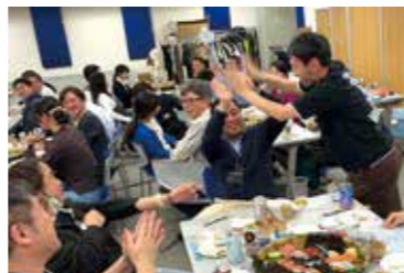
ゲームなどで交流を深めました