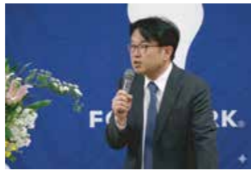
入社式の様子。社長あいさつ

東京で生まれ、児童期に約16年間カリフォルニア州、サンフランシスコの郊外のサンマテオ市で育ちました。これまでの経験を活かし、貢献していきます。