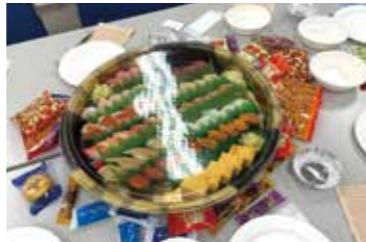
社内で歓迎会が開催されました