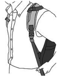
ショルダーストラップで体に密着