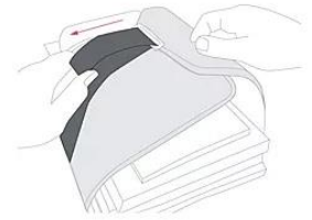
ブックストラップで教科書の揺れを軽減