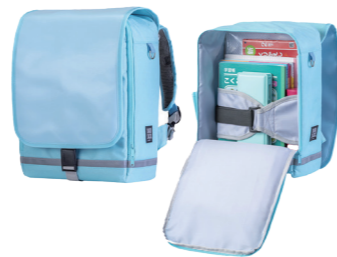
↑ラクサックジュニアプラス