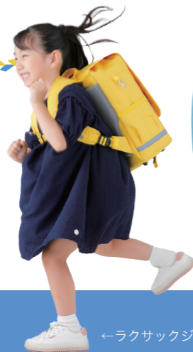
←ラクサックジュニア

発売してまもなく始めた「貸出サービス」は右肩あがりに利用者が増えています。革のランドセルを購入したものの、いざ学校へ登校してみると重くて体が痛い子どもが訴えてくる、といった悩みを抱えての申し込みも多くあります。曜日や季節での使い分けなどセカンドバッグとして利用される方もおり、ランドセルのあり方に大きな変化が見られます。