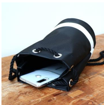
内側にポケット付き

楽天フットマークうきうき屋 https://item.rakuten.co.jp/ukiukiya/101433/