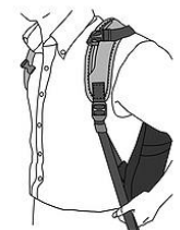
ショルダーストラップが体に密着