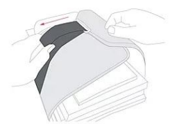
ブックストラップで教科書の揺れを軽減