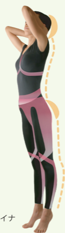
フィールアライナ

これからも「大学、病院、専門家、行政などの外部の組織と連携してフットマークがお客様（生活者・ユーザーさん）のために健康に役立つ創意あふれる商品とサービスを創り、お客様に提供していきたいと考えています。