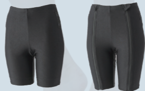
長持ちする水着・下