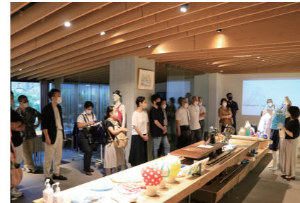
小さな博物館「フットマークギャラリー」を紹介

先日、東京墨田区の3M事業社が集まる懇親会がありました。「すみだ3M(スリーエム)運動」とは、1985(昭和60)年にスタートした、墨田区の産業PRとイメージアップ、地域活性化を図る事業です。フットマークでは小さな博物館として誰でも見学できる「フットマークギャラリー」を運営しています。