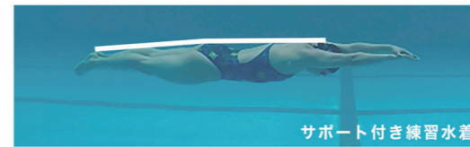
サポート付き練習水着