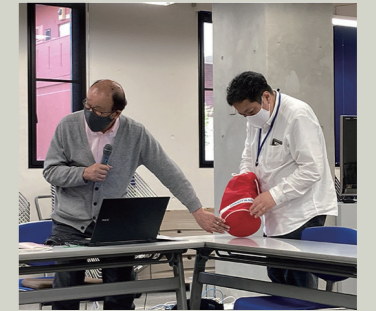
「ラウンド」ヒアリングの様子

フットマークでは2017年よりインナーブランディング活動に取り組んでいます。社内(社員)で「フットマークらしさ」の価値観を共有し、社員の意識や行動、言動やサービスをブランドの方向性と合致させることが目的です。今期は、「商品開発ストーリー」を先輩方からヒアリングし、フットマークの今後の財産として残そうという取り組みをしています。これまでに、「アニマルくん(水泳帽子)」「ベビーハーネス」「ラウンド(水泳バッグ)」「うきうきシャツエプロン」の開発者の話を聞きました。新商品開発を行う際や市場開拓をする際のヒントをたくさん得られる貴重な場となっています。