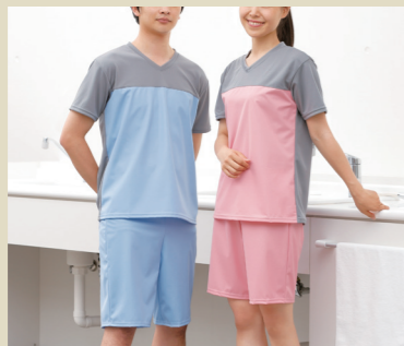
入浴介護Tシャツ・パンツ

ある介護施設での一コマ。スタッフの方が着ているのは、「入浴介護Tシャツ」と「入浴介護パンツ」。濡れたり蒸れたりする入浴現場はウェアでサポートします。足元は滑り止め効果の高い特殊なソールを採用した「ワークサンダル2」。特に細心の注意が必要な「入浴介護」でのヒヤリを防ぎます。フットマークではさまざまな介護スタッフの方向け商品を開発しています。