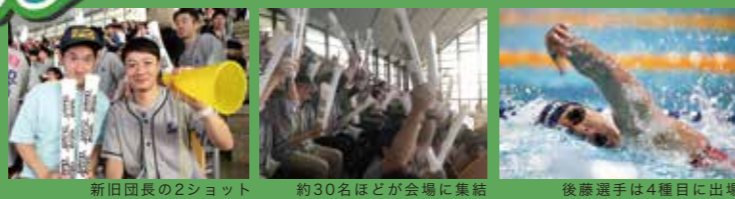
新旧団長の2ショット 約30名ほどが会場に集結 後藤選手は4種目に出場

競泳の日本選手権(4/2~4/8)が行われ、Jakedエリートチームの後藤真由子選手が出場しました。この大会は7月に行われる世界水泳(韓国)の代表権を争う大事な一戦。社内応援団「チームまゆごろう」も団長の指揮のもと、熱い声援を送りました。惜しくも目指していた結果とはなりませんでした。最後まであきらめない姿に力をもらいました。ご声援ありがとうございました。