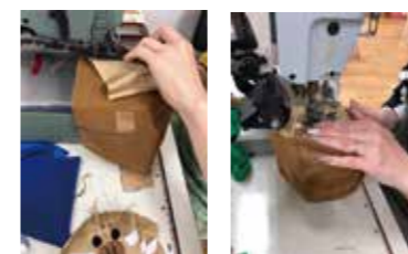
中央の顔を帽子本体に縫い付け