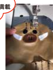
イノシシといえば、コレ