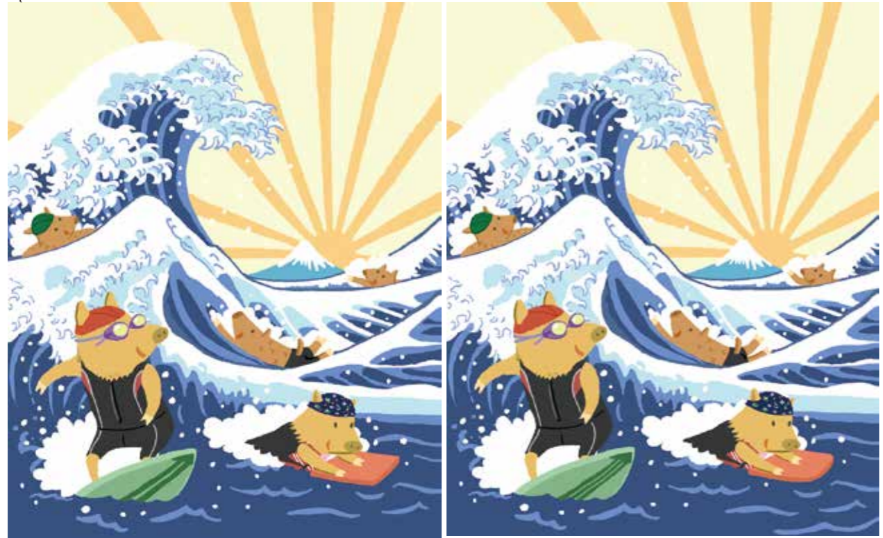
正解は最終ページにあります。 イラスト 長縄キヌエ

今年はいノシシの年です。 今月の1枚 今年の干支イノシシが初日の出とともに北斎の波に果敢に挑戦！幸先の良いスタートです。今年も良いことことがありますように。