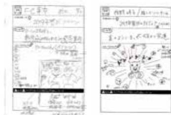
アイデア BOX よりアイデア募集