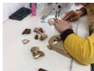
職人技の始まりです