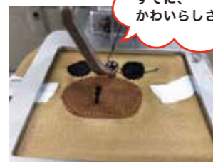
顔の表情が作られていきます