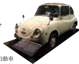
1955年に発売した軽自動車