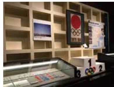
1964年東京五輪に関する展示

両国駅前にある江戸東京博物館。1993年に江戸東京の文化や歴史を学び、未来の事を考える場として開館され、今年の4月にリニューアルオープンしました。特徴的な外観もさることながら、入場すると実物大の日本橋が出迎えてくれます。江戸時代から平成に至るまでの東京(江戸)に関する展示が充実しており、前回の東京五輪についての展示もありました。