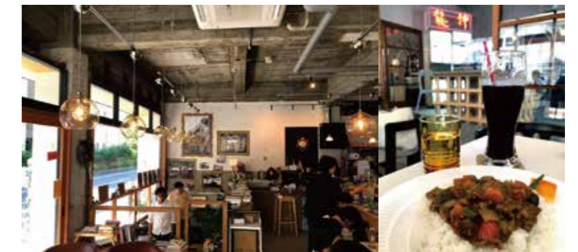
築55年の建物1Fをリノベーション

喫茶ランドリーは軽食を楽しめる喫茶スペースと、コインランドリーとアイロン、ミシン付きの「まちの家事室」を備えた現代版の喫茶店です。下町に突如現れるおしゃれな建物、元々は手袋の梱包作業場として使われていた空間をリノベーションしたもので、「どんなひとにも、自由なくつろぎ」をコンセプトに人々が集まり、憩う空間となっています。貸し切りイベントも多く、新しい取り組みが次々と生まれています。ぜひサイトをご覧ください。