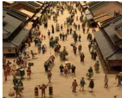
細かさすぎるジオラマ(江戸の町編)