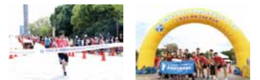
第2走者まで一位を独走！これはまさかまさか？期待に胸が膨らみ、応援にも熱が入りました！