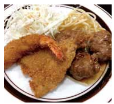
日替わりランチ 700円

マンションの一階にある昭和の雰囲気漂う「喫茶グリーン」。12時になると、すぐに近所のサラリーマンで店内は満席に。この日の日替わりはミートボールとアジフライ、エビフライのセット。ボリューム満点な上に、何と言っても700円というコストパフォーマンスが最高です。ちなみに11枚つづり7000円券もあり、メニューはほかにドライカレー、サンドイッチなど。店内には白鵬関のサインもありましたよ!