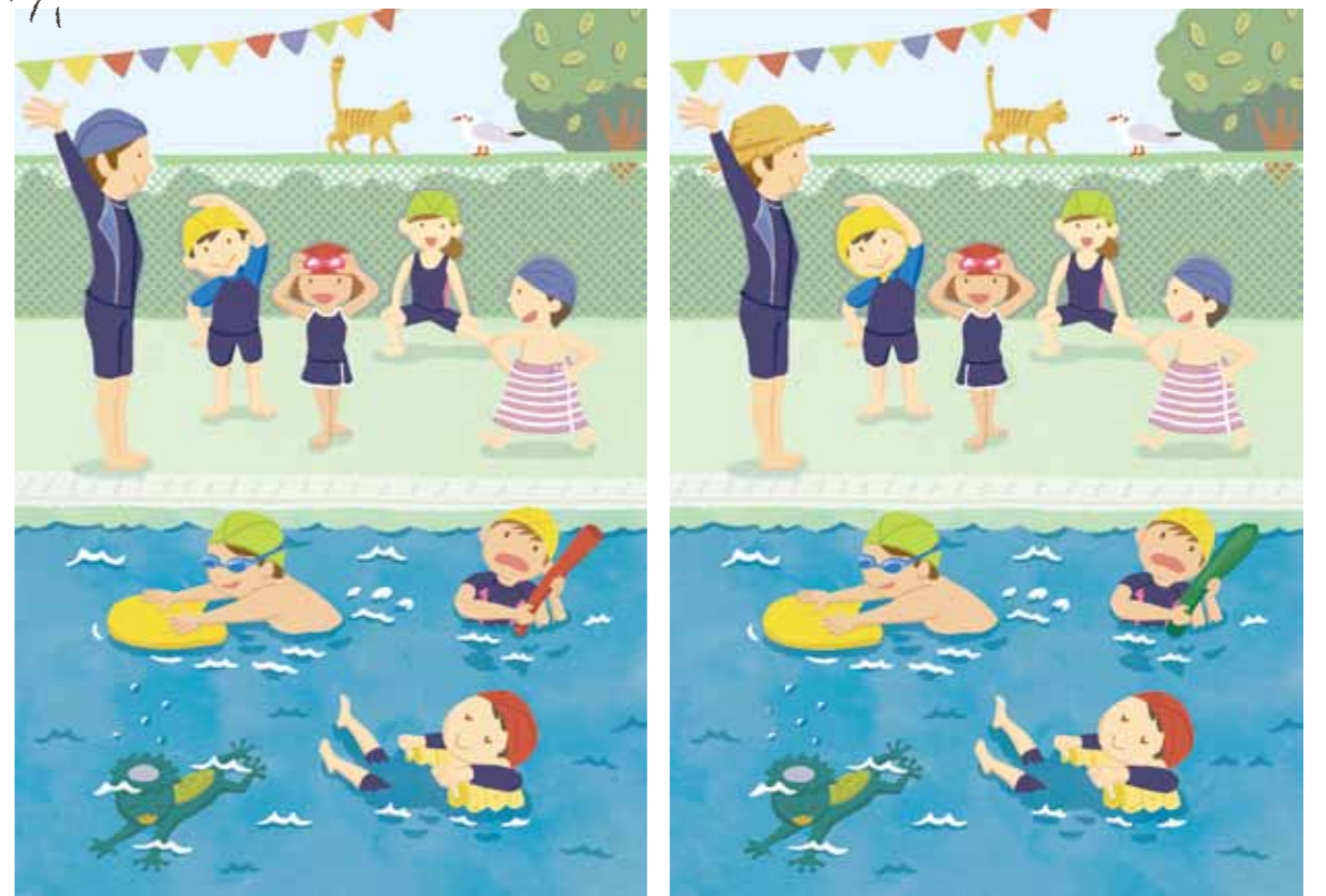
正解は次のページにあります。

今月の1枚 ..... いよいよ始まったプール開き! 学校の水泳授業の様子も年々変化しています。女子はセパレーツ型が主流。シャインガードを着て、紫外線対策をしている生徒もチラホラ。先生も日焼け対策に余念がありません。