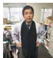
社長も自ら試着テスト

ゼロからの手探り状態の立ち上げでしたが、商品に対するアンケートにご協力頂いた1,600人以上のお客様の声が商品開発において、大きな力となりました。これからTable withとともに「新しい大人の食事習慣」を提案していきます。