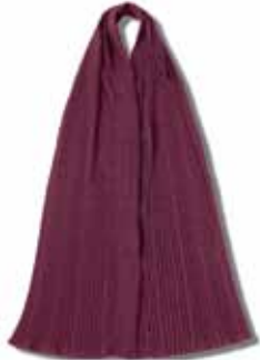
ブリーツタイプ (女性用)

「軽くて、さりげなく食事ができるおしゃれなエプロンがあればいいのに…」そんな声から生まれたブリーツをあしらったエプロン。持ち運びにも便利でストールにもなります。