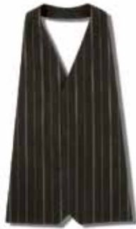
ベストタイプ (男女兼用)

「軽くて、さりげなく食事ができるおしゃれなエプロンがあればいいのに…」そんな声から生まれたブリーツをあしらったエプロン。持ち運びにも便利でストールにもなります。