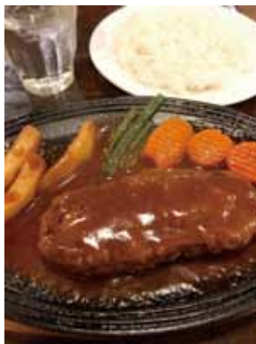
ジュージュー感がすごい

京葉道路沿いにある洋食屋さん。緑豊かな外観が目印です。写真には写っていませんが、定食にはお味噌汁もつきボリューム満点のメニュー。それで700円から!なんと目を疑うような良心的価格です。しかも大変美味しいのです!この日注文したのはハンバーグ定食。濃い目のデミグラスソースにご飯が進みます。自家製のパンやクッキーも販売しており、こちらもお土産におすすめです。