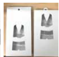
パッケージ検討中