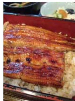
（うなぎ上）おすすめと言いつつ、肝吸いと漬物が中途半端な写りですみません。

大江戸線両国駅A5出口すぐのうなぎ屋さん。お店のそばを通るといつも食欲をそそる匂いが漂っています。うなぎの種類は並、上、特上、大串とあり、肉厚でふわふわに焼かれたうなぎの美味しさはもちろん、一緒に出てくる肝吸い、漬物も絶品です。ランチタイムのうなぎ・焼き鳥・卵焼きの乗った「らんち重」や「鳥さじ重」は各1,080円（税込）でお得感あり。ふと、うなぎを食べたい日ってありますよね？おすすめです。