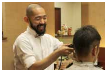
普段のお仕事の一幕。毎日予約でいっぱいの人気店です。

今はスポーツクラブネサンス北砂へ所属を変更し、マスターズに登録。水泳を好む方々と一緒に練習をしています。ここではトライアスロンをやっている方やトレイルラン、マラソン、ロードバイクなど様々な競技を趣味としている方々に会い、刺激を受けて昨年初めてオープンウォータースイムに挑戦！海で3000m泳ぎました！44分完泳です！プールとはまるで違う新たな水のスポーツです。泳法も違えば距離も長い、ただ自然の中で泳ぐというこれまた特別な感覚がとても楽しかったです。オープンウォータースイムも続けていけたらなと思っています。