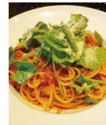
パスタは3種類、毎日変わります

両国では貴重なイタリアンのお店です。オシャレで清潔感のある店内は女性一人でも入りやすい雰囲気。実際この日もお客様はほぼ女性(男性もいますよ)。また特筆すべきはランチの良心的な価格!このご時世数年前と比べ値上がりをしたところも多いですが、その中でメイン + サラダで 820円は小躍りしそうな勢いです。パスタが食べたいときはぜひ、おすすめです。