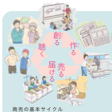
商売の基本サイクル

1/1 (いちぶんのいち) の視点とは、何千人のデータの中やリサーチの数字に表れるものではなく、たった一人の言葉を大切に、一人の人の話を、丁寧に聞くことからはじまるものづくりの考え方。フットマークのものづくりは、商品を考え出すことから販売、そしてお客様が使って評価いただくまで続きます。その基本サイクルを「創る→作る→売る→届ける→(声を)聴く」といい、各担当者がそれぞれの役割を担いお客様の声に応えています。