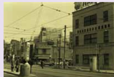
展示の一部。昔の京葉道路(国道14号線)

http://www.city.sumida.lg.jp/citypromotion/shuunennjigyuu.html