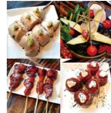
何を食べても美味しいです。親子丼もおすすめ（写真撮り忘れました…）

清澄道路沿いにある焼き鳥屋さん。ガラス張りに格子の外観は見るからにオシャレな雰囲気。店内は吹き抜けになっています。焼き鳥は何を食べても美味しいのですが、特にイチオシはフォアグラレバーです。ふわっふわで口の中にとろけます。またこの日食べたバーニャカウダー「両国の畑」の瑞々しい野菜に悶絶。ちなみにメニューは文字のみなので名前から料理を想像する楽しみもあります。夜だけの営業です。人気店なので予約がおすすめです。