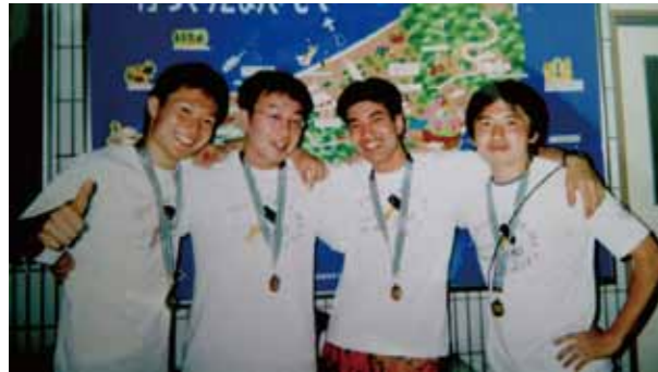
左から二番目が高校時代のIさん

M.I 職業 会社員、公認スポーツプログラマー、パーソナルトレーナー（兼業） 平日は、会社員として勤務。土日の休日は、子どものパーソナル指導をメインに水泳指導を行っている。現在では、大人向けのパーソナル指導や教室指導も行う。