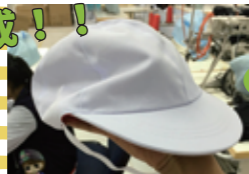
その後、検品・検診・糸切加工へ