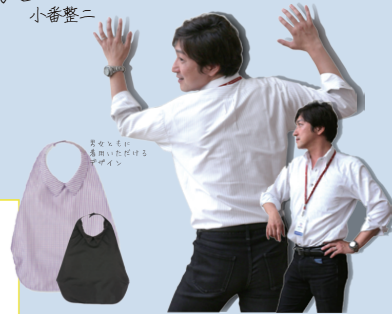
男女ともに着用いただけるデザイン