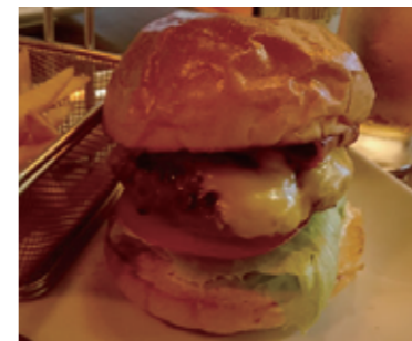
みんな大好き・ベーコンチーズ

両国駅と錦糸町駅の真ん中あたりにあるハンバーガー屋さん。食べログでも好評価の穴場と見ました。お酒も飲めるので夜もおすすめです。ハンバーガーを頼むと、熱湯からそのまま取り出してきたような(おそらくそう)ミニ網に入ったポテトも絶品です。何より店員さんの細かな対応が◎