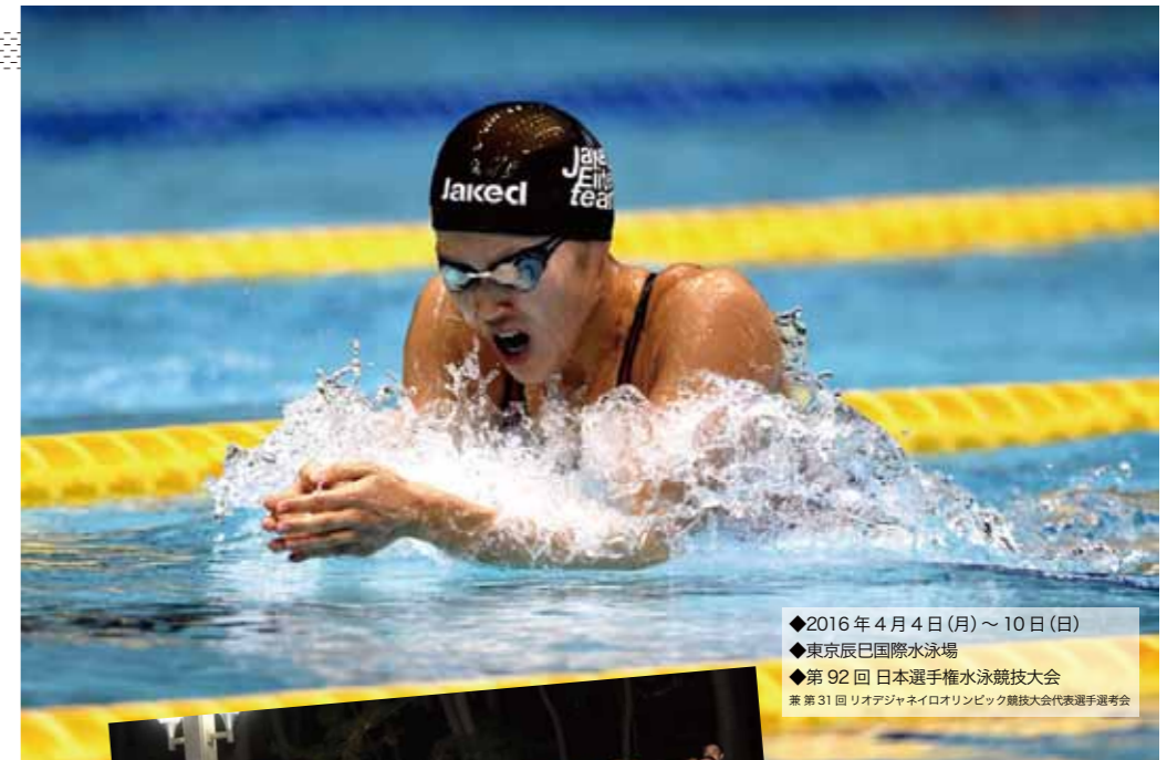
◆2016年4月4日(月)～10日(日) ◆東京辰巳国際水泳場 ◆第92回 日本選手権水泳競技大会 兼 第31回 リオデジャネイロオリンピック競技大会代表選手選考会

前半から果敢に攻め75m過ぎからトップに躍り出ると、ひとかきごとにほかを引き離す伸びやかな泳ぎで、100mのターンで早くも独壇場。最後は2位と4秒ほどの圧倒的な差をつけてゴール。電光掲示板に表示される「おめでとう日本新記録」。ひとつになった会場は割れんばかりの歓声と拍手に包まれた。