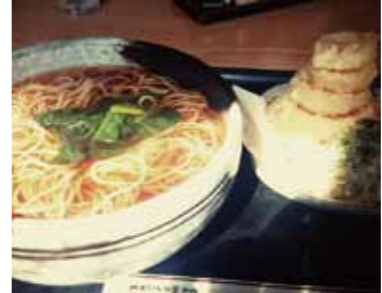
期間限定の新玉ねぎ天ぷらそば

昔ながらのおそば屋さん。そばはもちろんうどんもお任せあれ。定番に加え、季節に合わせた期間限定メニューも見逃せない。先月は新玉ねぎを使った新メニューが登場。威勢の良い看板娘のおばちゃんいわく「挑戦してみたのよ(笑)」。スカイツリーを彷彿させるタワー状になった玉ねぎがポイント。