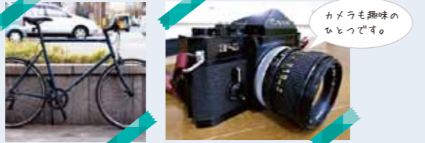
カメラも趣味のひとつです。