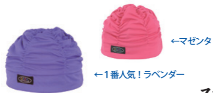
←1番人気！ラベンダー