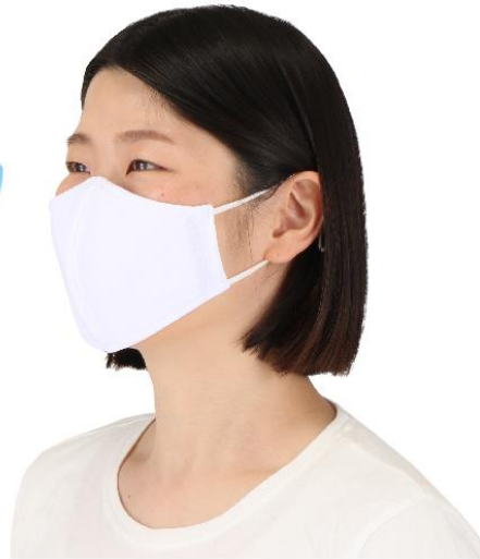
モデル着用サイズ：M

夏も ひんやり 快適冷感 -10℃ ※ ※計測環境：室温31度 乾いた不織布マスク表面温度と比較(自社試験)