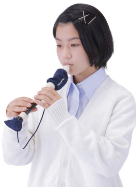
No. 3000030 リコーダー用カバー（ソプラノ用）

商品特設サイト https://www.footmark.co.jp/recorders/