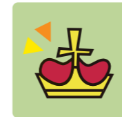
ブロガー：スポーツ部 菅原 (人間よりキノコを愛するデザイナー)

※フットマーク公式・公認ブログ一覧 http://footmark.co.jp/about/fm_blog.html