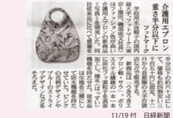
※詳細は広報ブログへ http://blog.livedoor.jp/footmark_pr/