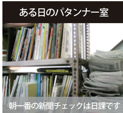
朝一番の新聞チェックは日課です