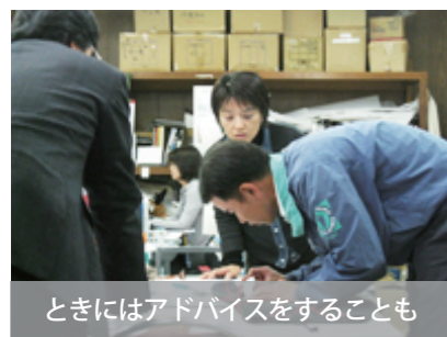
ときにはアドバイスをすることも