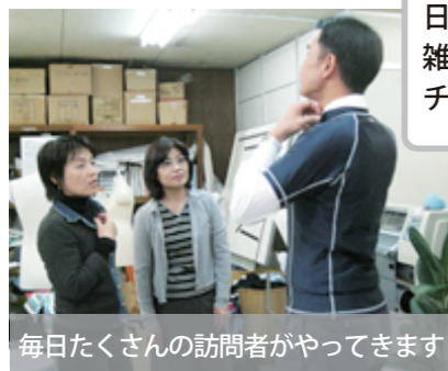
毎日たくさんの訪問者がやってきます