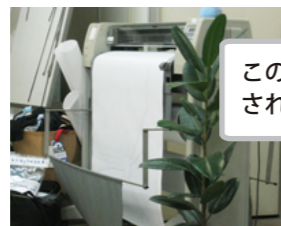
この機械から、パターンが出力されています。毎日フル稼働！

お客さまのご要望に応えられるよう、日ごろからの情報収集は欠かせません。雑誌などあらゆるものから流行をキャッチし、企画に生かせるよう心がけています。