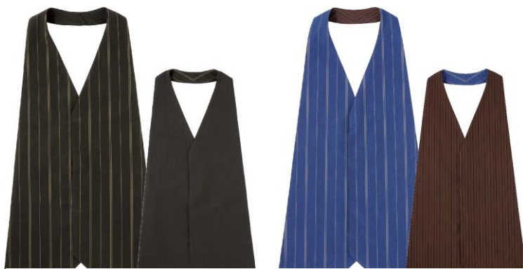
(1421) ブラック×ブラック