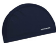
シリコンツウエイタイプ