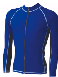
新商品。水着の上に着て紫外線を防止します。女性の先生用もあります。