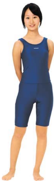
女子用セパレーツ型水着。 半袖・長袖タイプもあり股下の長さも選べます。