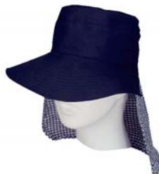
昨年の大ヒット商品！プールの監視時にも大活躍、フラップが収納できる帽子。