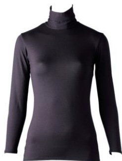
女性用 ハイネック9分袖