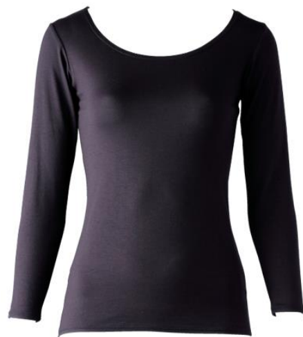
クルーネック 9 分袖