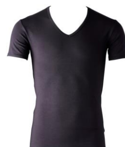
男性用 Vネック半袖