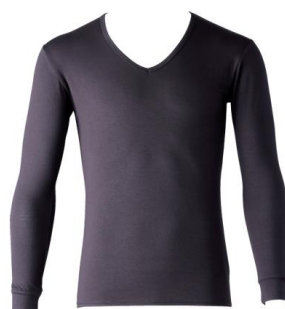
男性用 Vネック9分袖