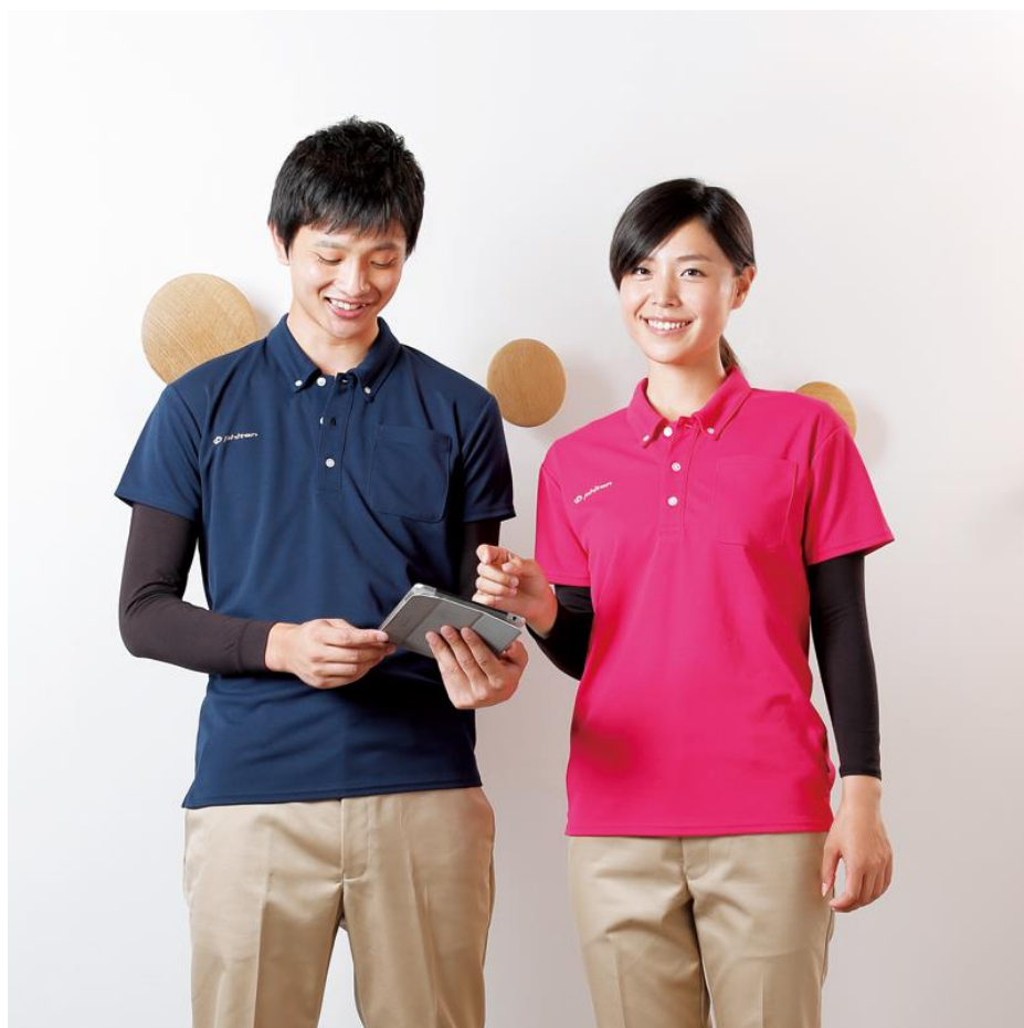
左) Vネック9分袖 Phiten ポロシャツネイビー Phiten チノパン 右) クールネック9分袖 Phiten ポロシャツピンク Phiten チノパン